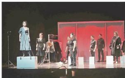
"Sala 13" busca rescatar el valor histórico y patrimonial de los inicios de la disciplina teatral universitaria en Chile.